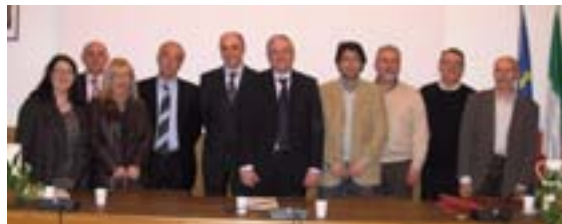
Foto di gruppo dei Sindaci presenti ad Albairate