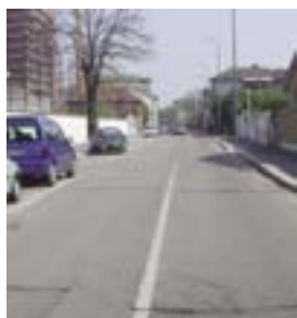
L'impianto semaforico inutite e pericoloso

La richiesta che facciamo al Comune di Milano nasce da un problema di sicurezza stradale che si è creato nella nostra strada per l'elevata velocità con cui le automobili transitano. La sezione stradale invita spesso insensati automobilisti a spingere sul pedale dell'acceleratore, non curanti del fatto che molte abitazioni si affacciano direttamente sulla strada mediante un piccolo marciapiede, ad esempio sul lato ove non è concessa la sosta con grave rischio per passanti e pedoni. Si chiede quindi un intervento tecnico con il posizionamento di dissuasori di velocità (castellane - già inutite e pericolose) approvate con delibera n° 82 del 6 novembre 2006 del Consiglio di Zona), analogamente a quanto avvenuto in via Mosca, per rendere più sicuro il transito e di conseguenza a pedoni.