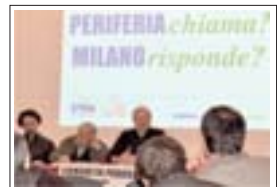
Le Periferie sono al centro dell'attenzione con l'iniziativa

L'iniziativa - In tale contesto, sarà offerta un'occasione di conoscenza e comprensione della situazione dei Consigli di Zona nell'ambito del ciclo "Periferia chiama! Milano risponde?", promosso dalla Consulta Periferie Milano ed organizzato dall'Associazione culturale San Materno-Figino. Quindi, martedì 12 aprile 2011 - alle ore 21 (Teatro don Aiani, Via F.lli Zanzottera 31 - Milano, dettagli sul sito www.periferiemilano.it ) avrà luogo l'incontro: Consigli di Zona: una storia "strana" . Un aiuto per conoscere e per deliberare perché la distanza tra "Amministratori" ed "Amministrati" tende ad aumentare invece che a diminuire.