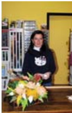
Il nuovo negozio di Merceria a Muggiano

Varcare la soglia di questa nuova attività, che ha aperto in via Antonio Mosca nei locali occupati fino a qualche anno fa dalla ricevitoria del lotto, è come ritornare indietro nel tempo: una macchina da cucire, un allestimento accurato con espositori ricchi di una vasta gamma di filati per il ricamo e non, tutto il corredo per il