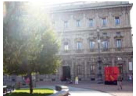
La facciata di Palazzo Marino che guarda in piazza della Scala

nali sono attualmente 60, di fronte siedono gli Assessori, il Sindaco, il Vice Sindaco ed il Segretario Generale. La Sala Alessi è l'attuale salone di rappresentanza del Palazzo. Qui si svolgono le conferenze stampa più importanti e sono ricevuti i Capi di Stato e i Regnanti. Con queste brevi note spero di avere stuzzicato la vostra curiosità e invito coloro che desiderano partecipare alle visite guidate a Palazzo Marino, in