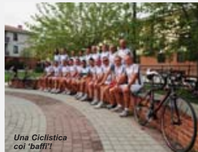
Una Ciclistica coi 'baffi'!

Epicentro della spedizione è stato Briançon, stazione climatica tra le più alte d'Europa, crocevia di cinque valli, tra le quali l'ampia Durance, sbarata ad est dal Monginevro, la verdeggiante Guisane a nord verso il Lautaret, e la selvaggia Val Cervyrette, ai piedi dell'Izoard.