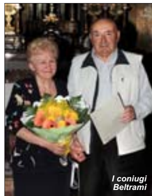
I coniugi Beltrami