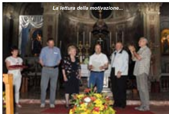
La lettura della motivazione...