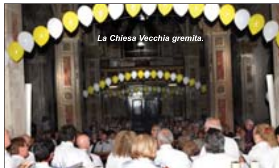
La Chiesa Vecchia gremita.