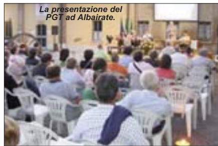
La presentazione del PGT ad Albairate.

Oltre 70 cittadini hanno partecipato all'incontro pubblico che si è svolto lo scorso 4 giugno nel cortile della Corte Salcano di Albairate, per avviare il processo partecipativo di elaborazione del Piano di Governo del Territorio. Il PGT è il moderno strumento di programmazione urbanistica introdotto dalla Regione Lombardia che sostituisce il vecchio Piano Regolatore Generale (PRG) e consente di ridisegnare il futuro del paese.