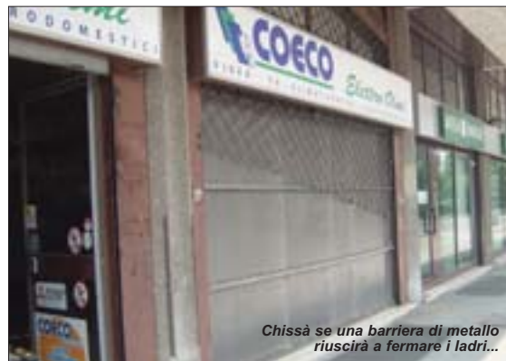
Chissà se una barriera di metallo riuscirà a fermare i ladri...

perpetua alla ricerca di qualunque cosa possa far reddito? Non lo sappiamo, quanto veramente offende la dignità umana è il quarto furto che vi raccontiamo. Qui non ci sono telecamere, impianti d'allarme o guardie: