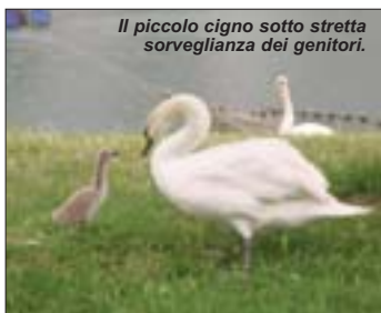
Il piccolo cigno sotto stretta sorveglianza dei genitori.

Due ragazzi di circa 14 anni e due bambini di 4 e 5 anni, disattendendo l'attenzione dei genitori, hanno iniziato a giocare sull'automobile della famiglia, parcheggiata nei pressi dello specchio d'acqua. Sganciato inavvertitamente il freno a mano, la vettura è velocemente scivolata in acqua ribaltandosi, imprigionando i due piccoli, meno solleciti ad abbandonare la macchina. Per fortuna il pronto intervento dei genitori e di alcuni avventori che si sono immediatamente gettati in acqua, ha permesso di estrarre dai finestrini i giovani, con un grande spavento. Avvertito telefonicamente dagli addetti alla sicurezza, il gestore dell'area ha prontamente allertato i Vigili del fuoco che sono intervenuti con estrema rapidità con autogrù e sommozzatori recuperando la macchina. La pericolosa situazione si è così risolta con il minore dei mali: un grande spavento e pochi danni alla vettura.