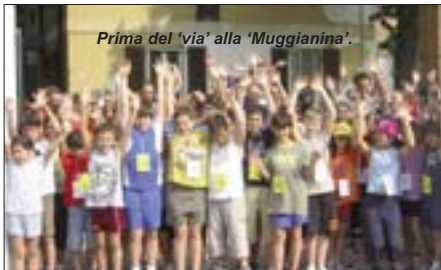
Prima del 'via' alla 'Muggianina'.

Un elogio ed un ringraziamento particolare al Gruppo Amici dell'Oratorio (GAO) per aver curato in ogni dettaglio l'intera macchina organizzativa della manifestazione: iscrizioni, percorso, sicurezza, pubblicità, medaglie, gadget, ristoro, con pochissimo tempo per l'organizzazione, dopo che il Gruppo Podistico di Muggiano, promotore dell'iniziativa, per impegni sportivi in calendario, non ha potuto portare a termine l'organizzazione della gara, come inizialmente pubblicizzato anche sul nostro mensile nei due numeri precedenti.