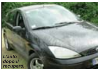
L'auto dopo il recupero.

Brutta avventura per una famiglia di origini filippine che partecipava ad un picnic sulle rive del Lago dei Cigni, presso cascina Guasconcina a Muggiano lo scorso 13 giugno.