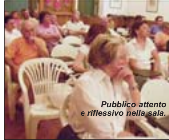
Pubblico attento e riflessivo nella sala.

gliata relazione sull'acqua, denominata anche "oro blu", dell'Assessore all'Ambiente Giovanni Pioltini, il quale ha affermato che "è in corso un processo di privatizzazione per mercificare l'acqua che invece deve restare un bene pubblico e accessibile per tutti. Oggi, sulla terra, 1 miliardo e 400 mila persone non hanno accesso all'acqua potabile (fonte OMS, 1998). La quantità d'acqua dolce pro capite diminuisce sensibilmente con il passare degli anni, fondamentalmente per tre fenomeni: aumento della popolazione; inquinamento; cambiamenti globali climatici. La normativa italiana prevede la privatizzazione dei servizi idrici e degli altri servizi pubblici, come rifiuti e trasporti".