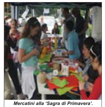
Mercatini alla 'Sagra di Primavera'.

Un ringraziamento particolare anche al direttore del Supermercato Billa che ha fornito alla Scuola un servizio buffet ottimo ed impeccabile.