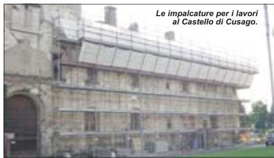
Le impalcature per i lavori al Castello di Cusago.

La nostra conversazione è interrotta da una telefonata al marito sul menage domestico-familiare, ma il sindaco, spento il cellulare, continua a darci attenzione e a spiegare sempre con la determinazione e la dialettica che la contraddistinguono. Abbiamo accennato al discorso "comunica-