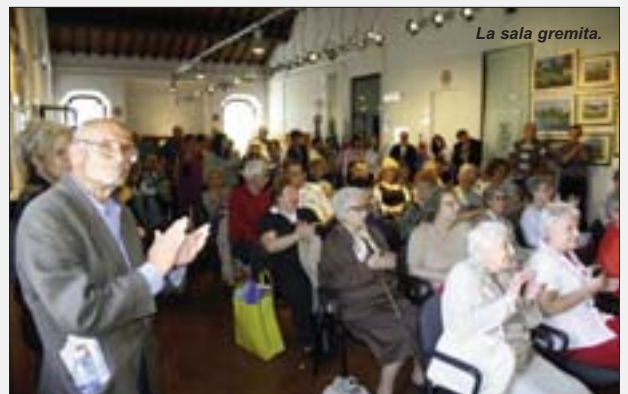
La sala gremita.